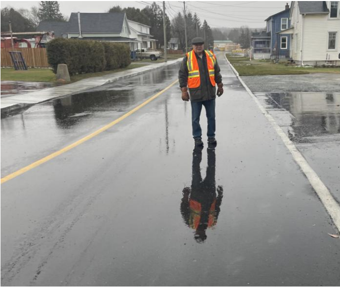
Photo : M. le maire sur la rue de l'Église après la fin des travaux le 26 novembre 2024.