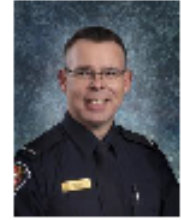
Par : Claude Lemire Tpi.

Régie intermunicipale de Protection contre l'incendie de Valcourt 541 Avenue du Parc, Valcourt, Qc (450) 532-1900 poste 3 prevention@coopitel.qc.ca