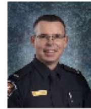
Par : Claude Lemire Tpi.

Régie intermunicipale de Protection contre l'incendie de Valcourt 541 Avenue du Parc, Valcourt (450) 532-1900 # 3 prevention@cooptel.qc.ca