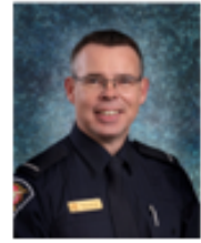
Par : Claude Lemire Tpi.

Régie intermunicipale de Protection contre l'incendie de Valcourt 541 Avenue du Parc, Valcourt, Qc (450) 532-1900 poste 3 prevention@cooptel.qc.ca