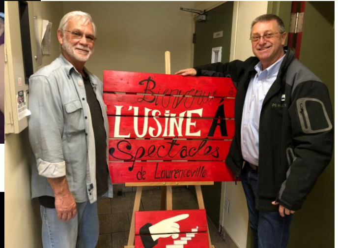
Quelques-uns des bénévoles et visiteurs présents à l'Usine à Spectacles lors du 5 à 7 du vendredi 27 avril 2018.