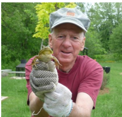
Clin d'œil : Sydney, un bon pêcheur de ouaouaron ?

Dans notre édition de juin nous vous faisons part de l'acquisition d'un coffre à jouer pour les jeunes de notre municipalité. C'est notre Service des Loisirs qui a contribué financièrement avec les autres organismes régionaux pour en faire l'acquisition.