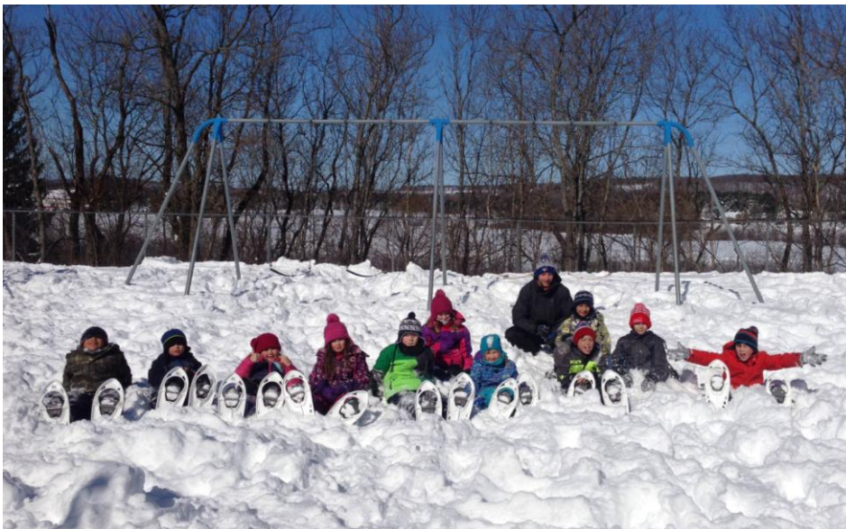
Photo : une sortie en raquette pour un groupe d'élèves de notre école le vendredi 17 mars dernier.

31 mars : Jour reprise tempête 14-17 avril Congé de Pâques 28 avril : Journée pédagogique