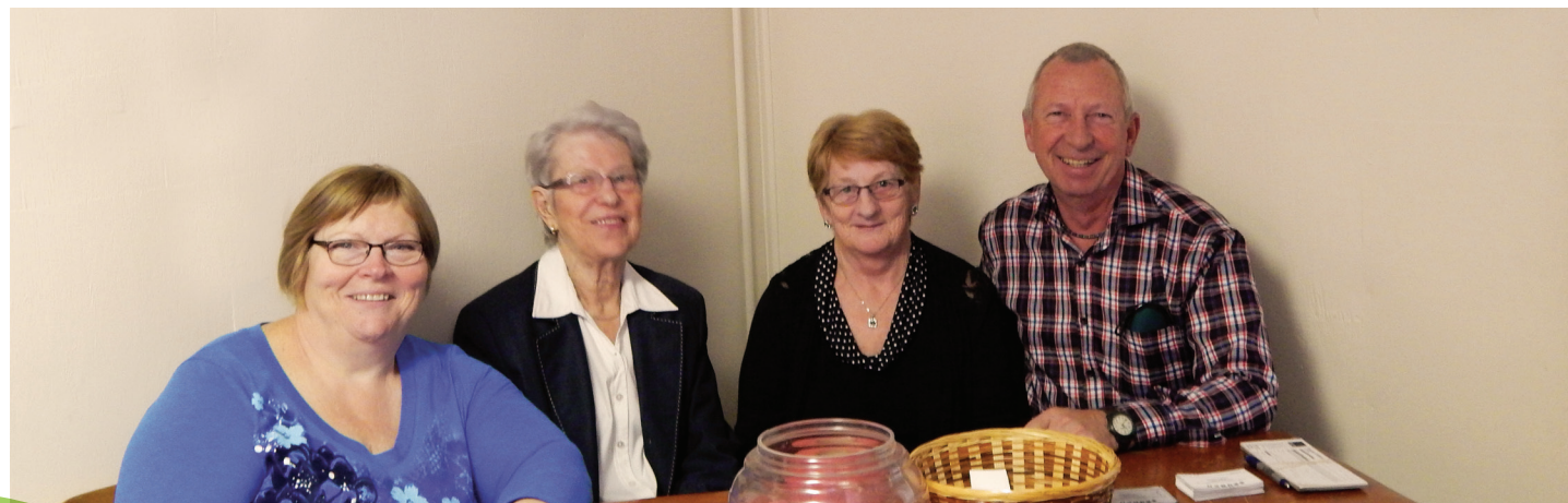
Comité d'accueil du brunch de la FADOQ

offre 11 logements (sans service) à Lawrenceville.