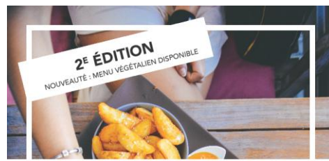
5 SOIRÉES AU MAGASIN GÉNÉRAL DE LAWRENCEVILLE